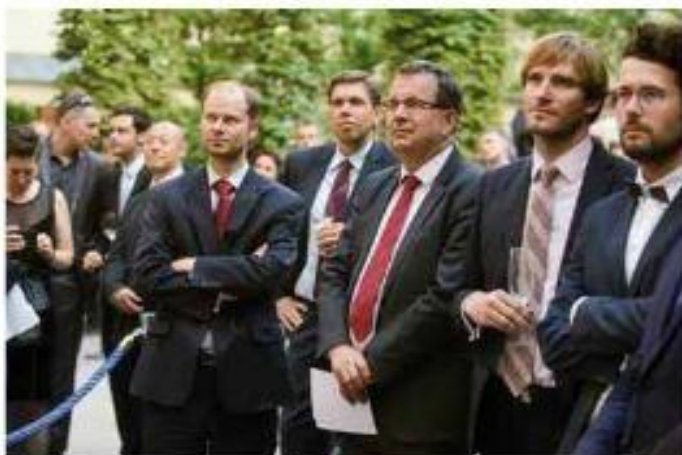
Ministr průmyslu a obchodu Jan Mládek při zahájení Pražské letní školy, nad kterou převzal garanci.

V Británii ví každý, že to jde, protože jde o jedno z nejmohutnějších odvětví moderních služeb. Odvětví s nejvyšší čistou přidanou hodnotou na ceně, a to v oblasti vysoce kvalifikované práce. Podobné je to v Americe. Už se tam nevyrábí tolik viditelných hmotných produktů, běžný textilní průmysl jim zmizel, automobily zápasí o přežití, ale export vzdělání kvete a přináší obrovské peníze.